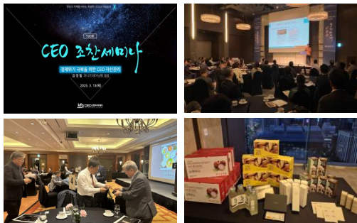
호텔 조식 / 이달의 도서 / 협찬품 제공

경영 & 경제 · 경영전략 · 트렌드 · 인문 & 사회 등 조직의 비즈니스 성장에 반드시 필요한 주제로 진행