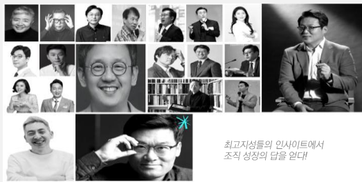
최고지성들의 인사이트에서 조직 성장의 답을 얻다

경영 & 경제 · 경영전략 · 트렌드 · 인문 & 사회 등 조직의 비즈니스 성장에 반드시 필요한 주제로 진행